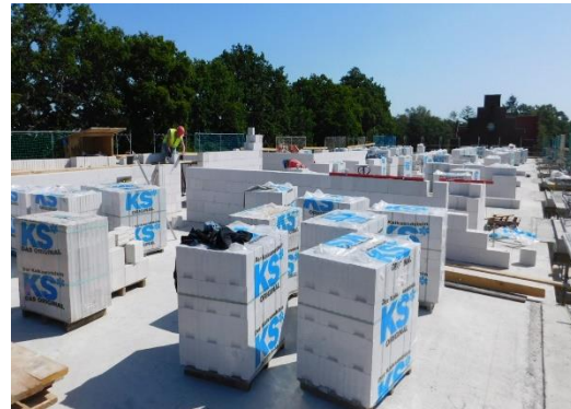
Anlieferung des Steinmaterials erfolgt