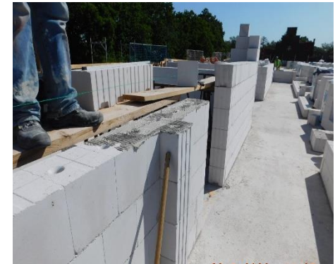
Beginn der Aufmauerung