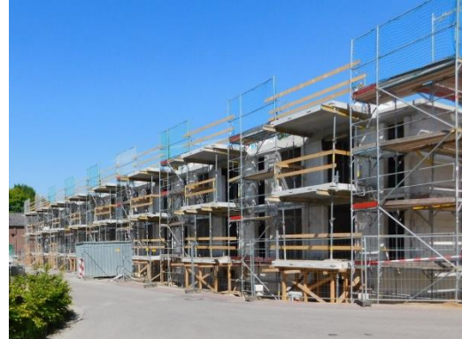
Haus 10 – Fertiggestellte Balkonkragplatten

Im nächsten Schritt werden die tragenden Wände des Dachgeschosses auf Raumhöhe gebracht, um dann die Decke über diesem Geschoß betonieren und das Dach richten zu können.